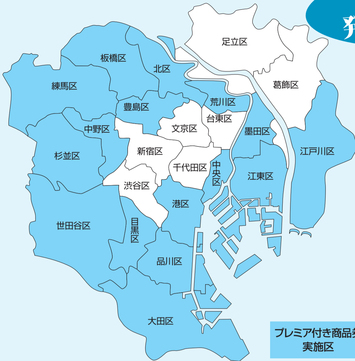
プレミアム付き商品券 実施区