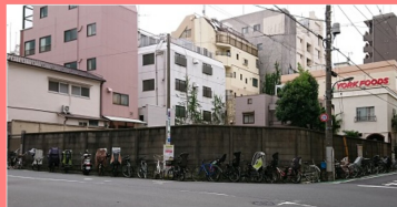
早稲田駅整理区画 5 6 台