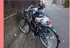
余丁町小整理区画 3 6 台