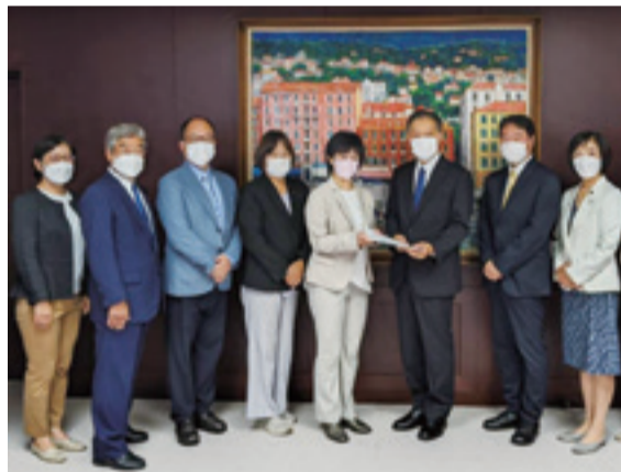
「2023年度予算要求書」を提出しました。