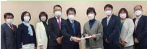
申し入れを行う区議ら

国の給付金は非課税世帯を対象としてきましたが、日本共産党は「困っている課税世帯にも給付金を!」と提案し、区議選の公約にも掲げてきました。 区議選直後、3万円の給付金が所得300万円未満の世帯(全世帯の約6割)にも支給されましたが、今回の給付金も課税世帯まで対象を拡大するよう要求しています。